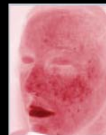
Cruce polarizado RBX-Rojo