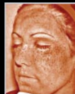
Cruce polarizado RBX-Café